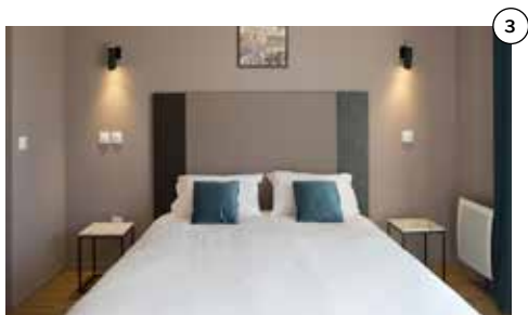
Résidence**** (1) directement reliée à vos espaces de soins