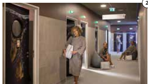
Établissement thermal premium